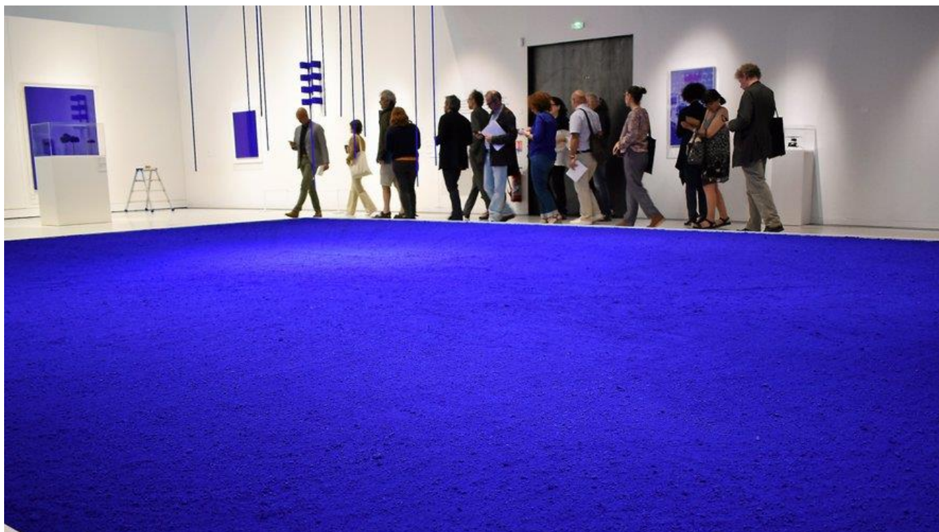
"Pigment Pur", un bassin rempli de pigment IKB au cœur du musée Soulages.

Voilà ce que dit Klein qui déclare sa flamme au fameux bleu IKB (International Blue Klein) une manière de peindre déclarée à l'I.N.P.I. Le Bleu de Klein est une marque de fabrique et un état d'esprit, scellée par sa pratique monochrome, c'est-à-dire peindre au rouleau sur une surface de toile. La couleur est unie, ne tremble pas. C'est une couleur sans pathos. Il y a bien entendu d'autres couleurs, mais ce qui compte est dans l'évocation de ces cris bleus, la radicalité du geste, sa continuité, la route à tracer, notamment avec l'intervention du corps, les fameuses Anthropométries qui viendront par la suite.